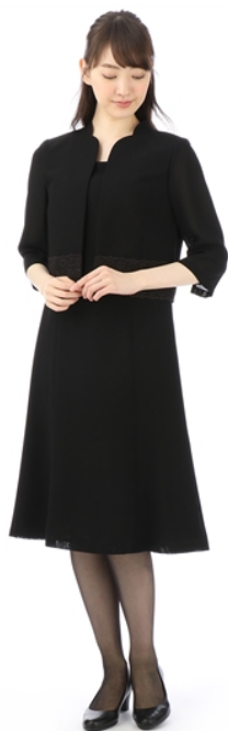
ツーピース風サマーフォーマル ／価格:29,000円（税抜）