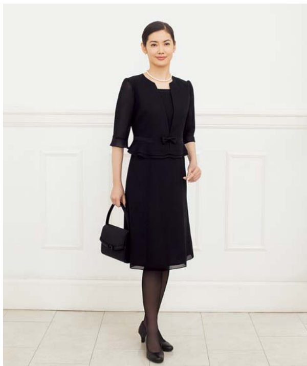
ウォッシュابل仕様／価格：29,000 (税別)