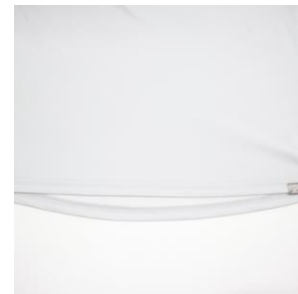
後身ロング丈仕様