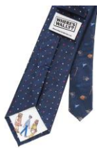
大剣裏のキャラクター

※Universal Studios Licensing LLC(ユニバーサル・スタジオ・ライセンシング LLC)との商品化契約に基づき、(株)和商インターナショナルが生産した商品です。