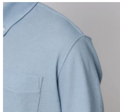
<肩まわりのシルエット>

ビジネスシャツの縫製技術を取り入れた立体的な襟まわりにすることできちんとした印象に