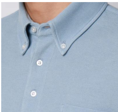
<きちんと感のある台襟>

ビジネスシャツの縫製技術を取り入れた立体的な襟まわりにすることできちんとした印象に