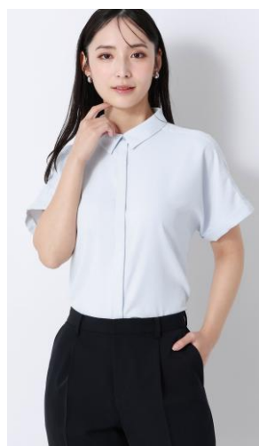
ちび襟と軽やかなロールアップ風の袖口がポイント