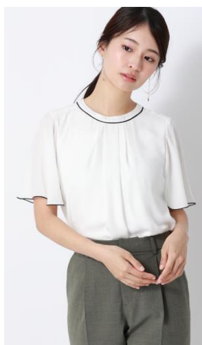
襟元と袖の配色パイピングがアクセント