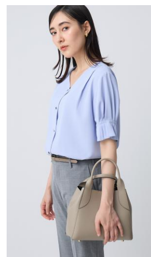
袖のタックデザインとフロントのメタルボタンがアクセント