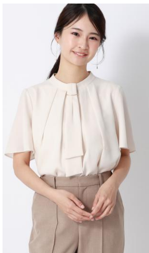
取り外し可能なアクセ付きボウタイで着回し可能