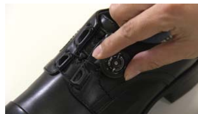
画像：ダイヤル式巻き上げシステム