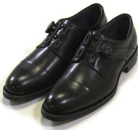
画像：「軽快歩行シューズ」