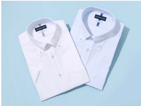
画像：『スマートビズ Ag + 』