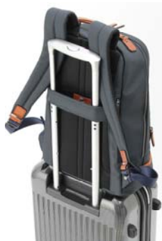
画像：背面のキャリーバー通し