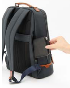
画像：前面ファスナーポケット内側に機能ポケット