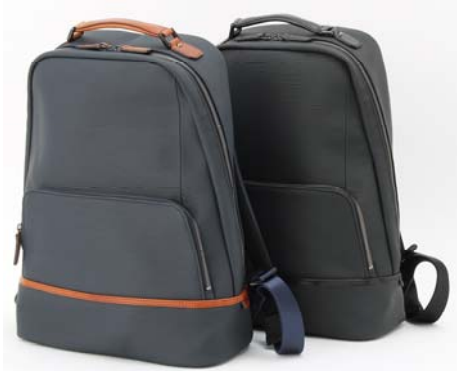
画像：生地は「水シボ」と呼ばれる水が流れるような細かな凹凸のあるデザイン