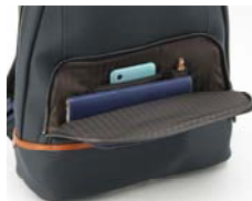
画像：財布などの小物類が収納可能なサイドポケット