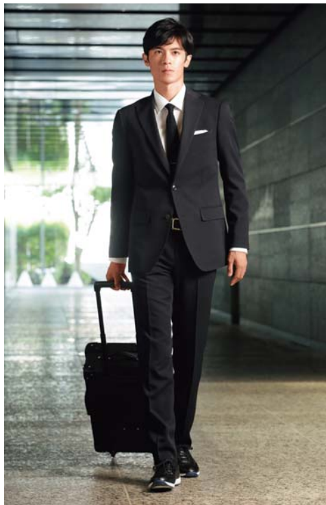
新ブランド「アーバンセッター」 スーツ着用画像