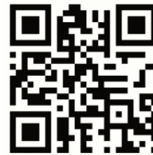
【タグの QR コード】

■ 当社は、「エコテックス®メイドイングリーン」 認証ラベルのシャツの取り扱いを通じて、下記の SDG s への貢献を目指します。