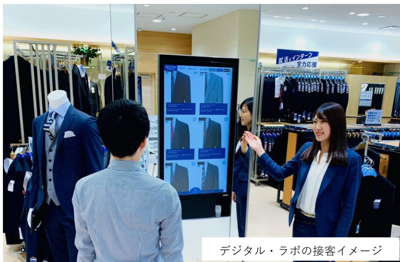
デジタル・ラボの接客イメージ

「洋服の青山」独自システム『デジタル・ラボ』、今期は年間100店に新導入 大型画面を使い“全店在庫”から商品を選んで店で試着・採寸、セルフ機能で“非接触”利用も