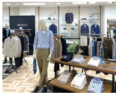
“Bizカジ”商品コーナー