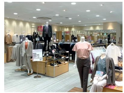
レディス商品コーナー