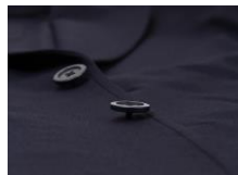
生地に厚みをもたせて 季節感ある風合いに

スーツ生地は、旭化成株式会社のストレッチ繊維「ROICA®（ロイカ）」を使用したニット生地で、縦・横の両方向への高い伸縮性が特徴です。一般的なスーツと比べて縦・横ともに6倍（当社比）のストレッチ性を誇るなど、抜群の動作性と解放的な着心地を体感できます。また、自宅の洗濯機で丸洗いが可能でシワになりにくいなどイージーケア性にも優れています。