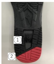
①ミズノウエーブ搭載 ②耐摩耗ラバー「X10」