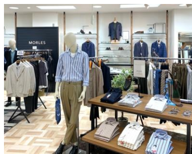
“Bizカジ”商品コーナー