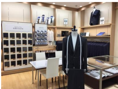
オーダースーツコーナー

システムを導入したこれらの店舗ではスーツ売場の一部を縮小し、現在強化しているオーダースーツコーナー・テレワークにも対応するビジネスカジュアル商品やレディス商品を拡充するなど、売場の再構築を行っています。今後導入する店舗においても売場を有効活用し、各店舗の需要や地域特性に即した魅力ある売場を目指していきます。