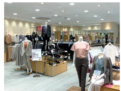
レディス商品コーナー