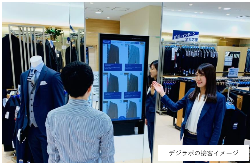
デジラボの接客イメージ

青山商事株式会社（本社：広島県福山市／代表取締役社長：青山 おきま 理）は、ネットとリアルの融合システム「デジラボ」について、今期は2023年3月末までに新たに「洋服の青山」120店に導入します。システム導入は6月14日（火）より順次開始し、ご来店のお客様に「洋服の青山」ならではの買い物体験を提供していきます。※記載情報はリリース発表時現在のもので、事業環境の変化等の様々な要因により変更となる場合があります。