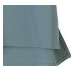
着丈は後ろをやや長めに