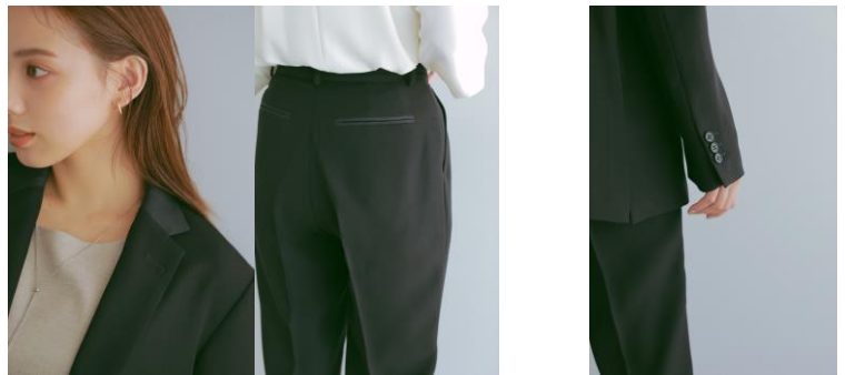
襟とヒップポケットのサテン切り替え

カラー ブラック 素材 ポリエステル 65% 複合繊維 35% (ウォッシュابل) 価格 ジャケット：税込 16,500 円 パンツ：税込 9,900 円