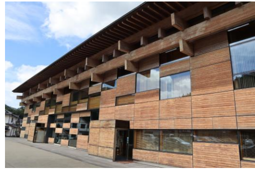
梼原産材の杉材がふんだんに使用された梼原町総合庁舎