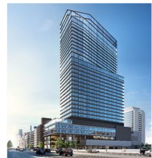
市街地再開発事業