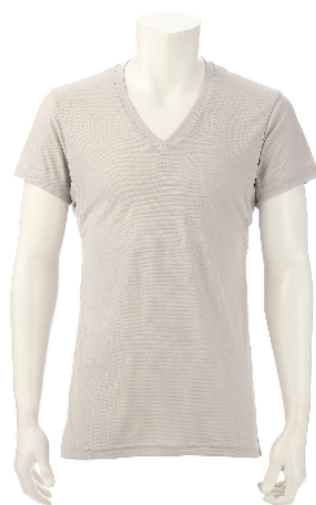
【画像】アイスタッチ肌着