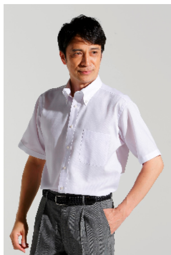
スタンダード／半袖