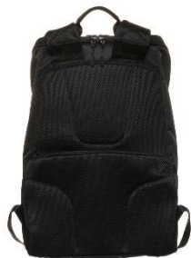
バッグの背当て面