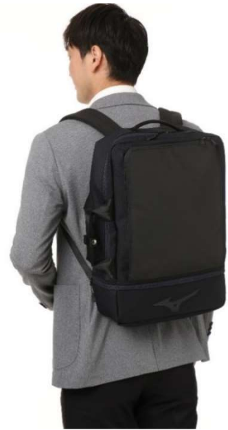
画像：エアロ 3WAY ビズバッグ

『エアロ 3WAY ビズバッグ』では、背当て面の4箇所パッドを装着することで上下・左右に通気路を確保し、背中の蒸れを軽減します。また、「バックパック」と「手提げ」に加えて、付属のキャリーケース用ストラップを取り付けることで「キャリーオンバッグ」としても使用できる3WAY仕様となっています。