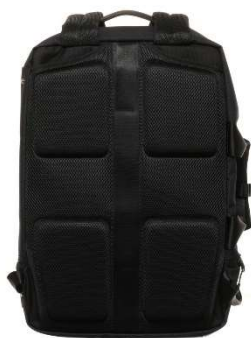
バッグの背当て面