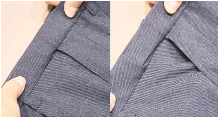
フロントに設置したスマートブレスト ※ウエストがサイドに伸びる仕組み