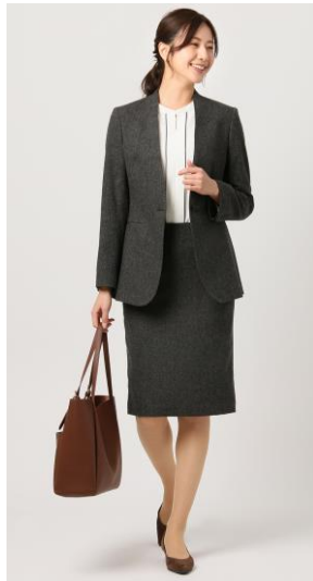
Vカラージャケット

昨今、環境配慮の観点からリサイクルポリエステルなど様々なエコ素材が注目されています。そのような中で、今回は不要になった衣料や裁断クズを再利用したリサイクルウール「RE:NEWOOL®リニューール」を使って仕立てたスーツを企画しました。「RE:NEWOOL®リニューール」は、不要になった衣類や工場の裁断クズを尾州産地（愛知県北西部から岐阜県岐阜市にかけての地域）に集め、仕分けから紡績、仕上げまでの生地作りのすべてを尾州で一貫して行っています。また、職人の手で色別に細かく仕分け、絶妙なバランスで調合された生地の美しい色合いは、尾州産地だからこそ表現できる技術です。さらに、裏地にはリサイクルポリエステルを採用し、表地も裏地もエコ素材を取り入れたサステナブルスーツです。