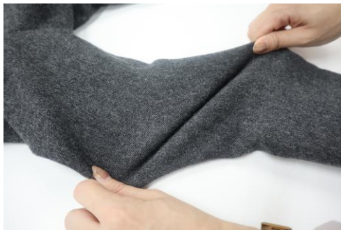
優れたストレッチ性