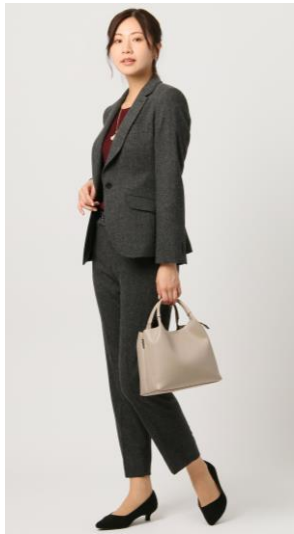
テーラードジャケット

青山商事株式会社（本社：広島県福山市／代表取締役社長：青山 理 おさむ ）は、廃棄衣料や裁断クズを再利用したリサイクルウール「RE:NEWOOL®リニューール」を使って仕立てたスーツを、11月15日（水）から洋服の青山主要500店舗および、公式オンラインストアで発売します。商品ページ： https://tinyurl.com/6fu4n9sp