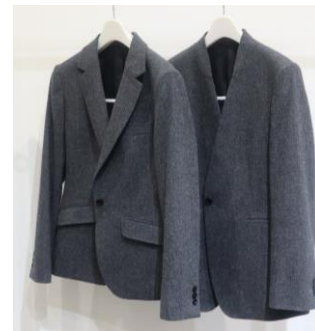
左：テーラードジャケット（ショート丈） 右：Vカラージャケット（やや長めの着丈）