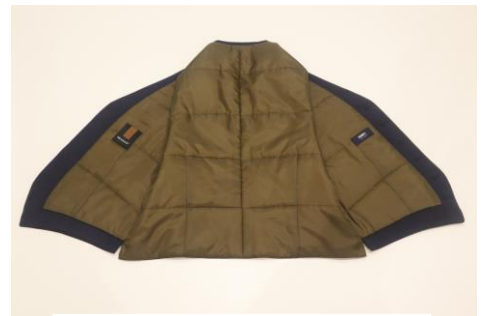
ヒーテス中綿ジレ