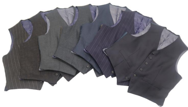
カノニコダウンジレ（全7種類）

冬の防寒対策として、スーツの下にニットやベストなどカジュアルテイストのアイテムを着用することが定番になりつつあります。そのような中、会議や商談時でもスーツスタイルに相応しい暖かいインナーを着用したいなどのお客様の要望を受け、この度スーツライクな「キレイめ中綿ジレ・ダウンジレ」を企画しました。今回のジレは、前身頃にストレッチ性に優れた表地と機能性中綿「ヒーテス」を使用したジレと、350年以上の歴史をもつイタリアの老舗生地メーカー「カノニコ」の生地を使用したダウンジレの2型を展開します。