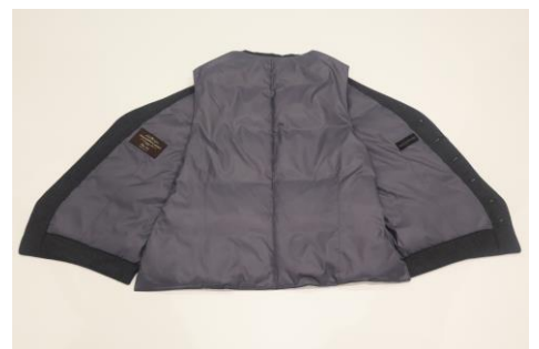
カノニコダウンジレ