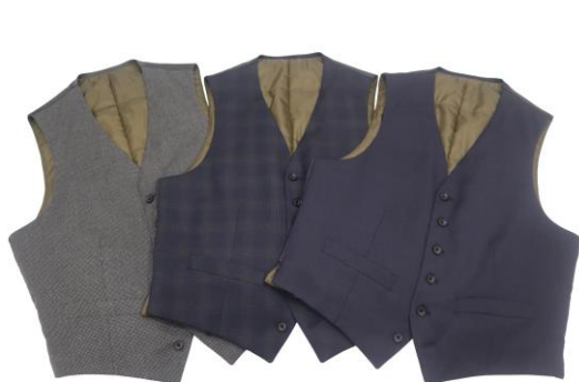
ヒーテス中綿ジレ（全3種類）

「ヒーテス」中綿ジレ商品ページ： https://tinyurl.com/cn6mc7f3