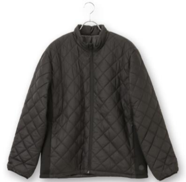
スタンドカラーブルゾン（ブラック）