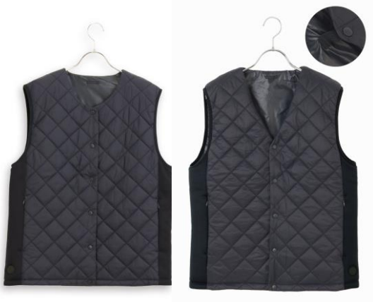
クルーネックベスト（ネイビー）