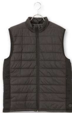
スタンドカラーベスト（ブラック）