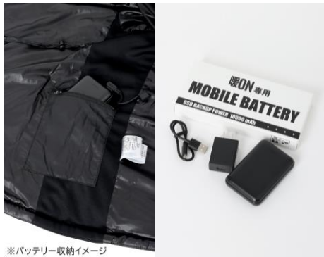
※バッテリー収納イメージ